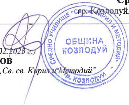
ГРАФИК ЗА ПРОВЕЖДАНЕ НА ПЕРИОДИЧЕН ПИСМЕН КОНТРОЛ II срок на учебната 2022/2023 година

Директор на СУ „Св. св. Кирил и Методий“ гр. Козлодуй