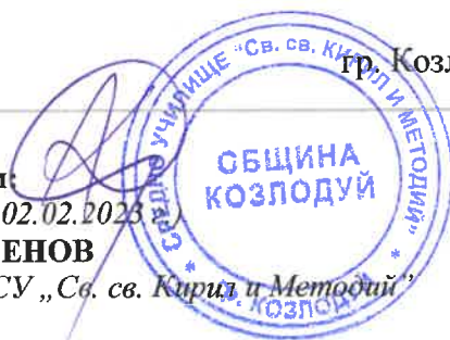
ГРАФИК ЗА ПРОВЕЖДАНЕ НА ПЕРИОДИЧЕН ПИСМЕН КОНТРОЛ II срок на учебната 2022/2023 година

Директор на СУ „Св. св. Кирил и Методий“ гр. Козлодуй