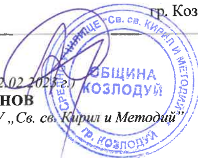
ГРАФИК ЗА ПРОВЕЖДАНЕ НА ПЕРИОДИЧЕН ПИСМЕН КОНТРОЛ II срок на учебната 2022/2023 година

Директор на СУ „Св. св. Кирил и Методий“ гр. Козлодуй