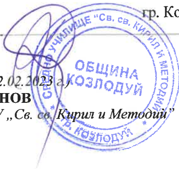
ГРАФИК ЗА ПРОВЕЖДАНЕ НА ПЕРИОДИЧЕН ПИСМЕН КОНТРОЛ II срок на учебната 2022/2023 година

Директор на СУ „Св. св. Кирил и Методий“ гр. Козлодуй