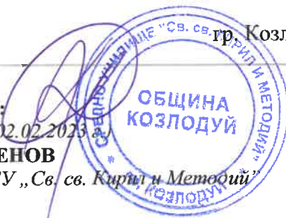
ГРАФИК ЗА ПРОВЕЖДАНЕ НА ПЕРИОДИЧЕН ПИСМЕН КОНТРОЛ

Директор на СУ „Св. св. Кирил и Методий“ гр. Козлодуй