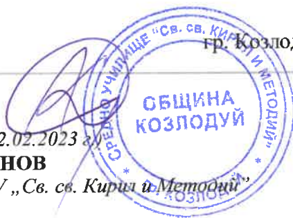
ГРАФИК ЗА ПРОВЕЖДАНЕ НА ПЕРИОДИЧЕН ПИСМЕН КОНТРОЛ

Директор на СУ „Св. св. Кирил и Методий“ гр. Козлодуй