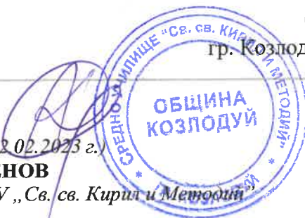
ГРАФИК ЗА ПРОВЕЖДАНЕ НА ПЕРИОДИЧЕН ПИСМЕН КОНТРОЛ II срок на учебната 2022/2023 година

Директор на СУ „Св. св. Кирил и Методий“ гр. Козлодуй