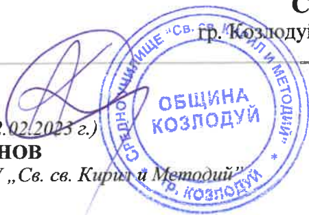
ГРАФИК ЗА ПРОВЕЖДАНЕ НА ПЕРИОДИЧЕН ПИСМЕН КОНТРОЛ II срок на учебната 2022/2023 година

Директор на СУ „Св. св. Кирил и Методий“ гр. Козлодуй