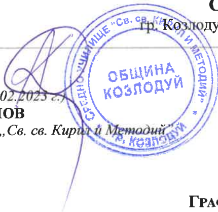
ГРАФИК ЗА ПРОВЕЖДАНЕ НА ПЕРИОДИЧЕН ПИСМЕН КОНТРОЛ II срок на учебната 2022/2023 година

Директор на СУ „Св. св. Кирил и Методий“ гр. Козлодуй